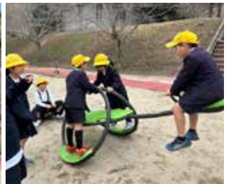
3月に届いた、念願の外遊具 (ジャングルジム 2台 シーソー 2台)