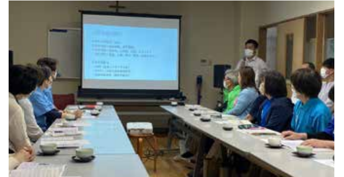
児童養護施設「シオン園」訪問研修

民児協は毎月の定例会の際に、研修会を行っております。5月8日に荒尾市にある児童養護施設「シオン園」を訪問して、児童福祉を学びました。