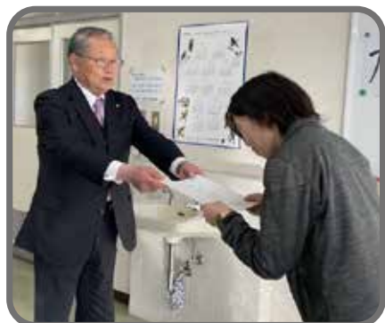
▲前田会長より修了証を受け取る受講生