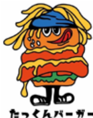
たっくんバーガー

営業時間は11~19時、定休日は水曜! キッチンカーの出店スケジュールの確認はインスタ (takuma9330) を見てね!