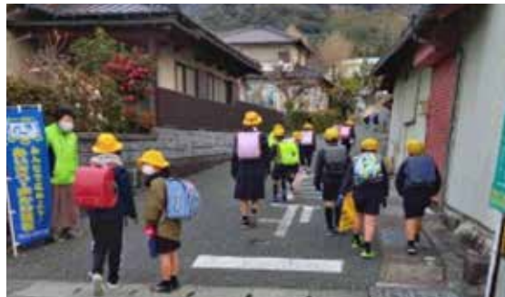
▲木葉地区あいさつ運動の様子