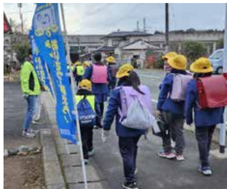
▲山北地区あいさつ運動の様子