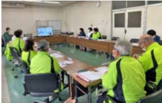
▼定例会後の研修会の様子

民児協では、年間行事として様々な活動を行っています。2月の定例会後は、ビデオ鑑賞による民生委員・児童委員の新任研修を行い、改めて民児協の役割を再認識致しました。